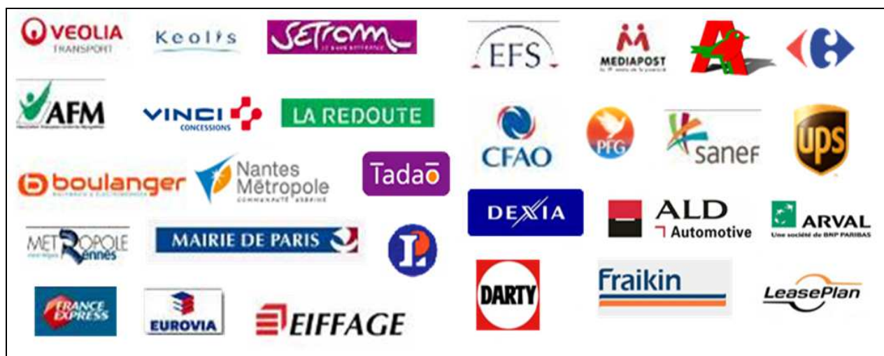
Principaux clients Grands Comptes Privés

La Société DURISOTTI est ainsi en mesure d'assurer la modification en moyennes et grandes séries de modèles de véhicules spécifiques pour ses clients et effectue des aménagements sur des flottes entières de véhicules.