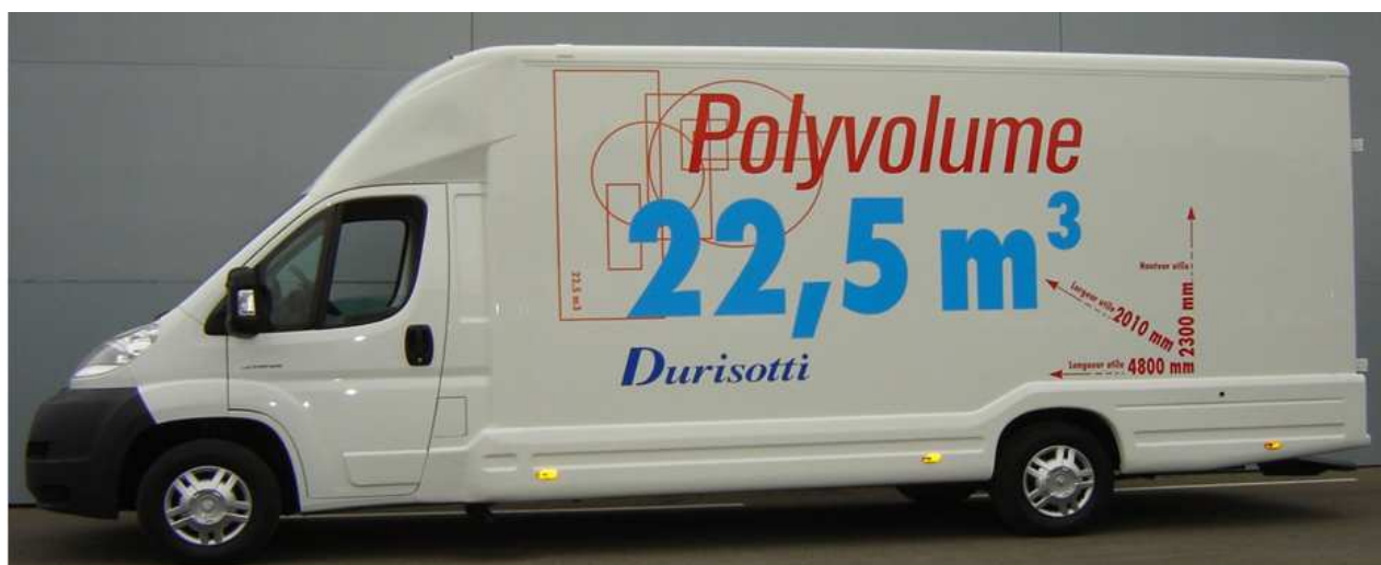
Exemple de réalisation d'un utilitaire pour les réseaux de constructeurs toutes marques

La Société DURISOTTI est en mesure de répondre aux demandes des Concessionnaires automobiles et aux appels d'offres des Collectivités.