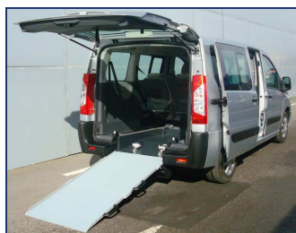
Individuel (de 3 à 7 pers. + 1 faut. roul.)

La société DURISOTTI aménage les véhicules pour le transport individuel et collectif de personnes valides et à mobilité réduite.