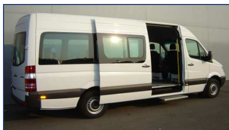
Collectif (jusqu'à 6 faut. roul.)