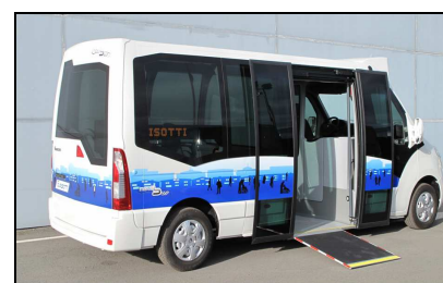
Minibus urbain (jusqu'à 23 pers.)